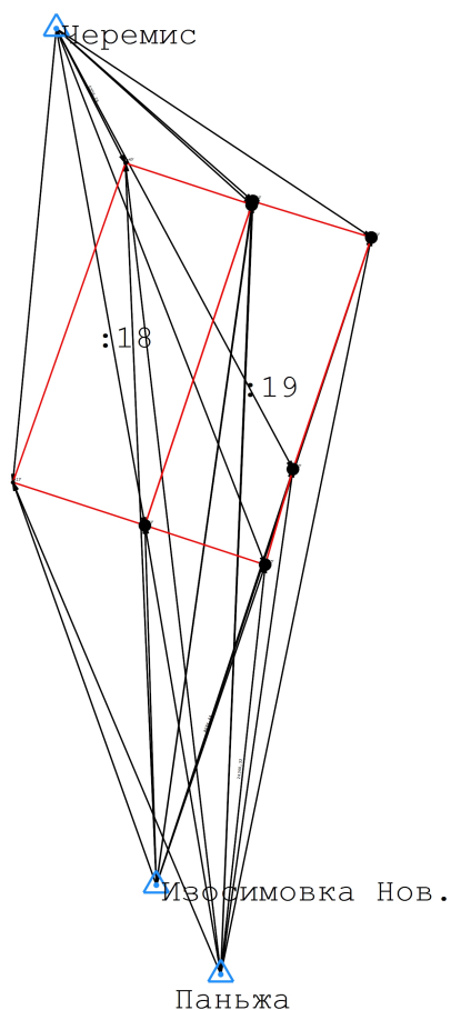
Схема геодезических построений